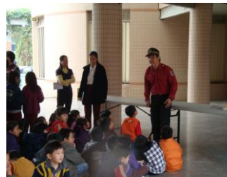
消防隊講解消防知識