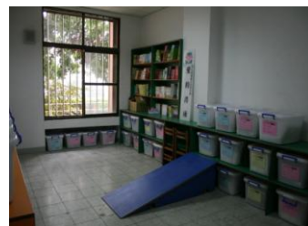
過埤國小愛的書庫

一、本校為財團法人台灣閱讀文化基金會愛的書庫鳳山南區承辦學校，目前已完成所有軟硬體的準備工作，在本校試營運。各班級反映熱烈，借閱情形踴躍。預計於六月十日正式開放營運，屆時本市教育局長及基金會執行長將蒞校剪綵。