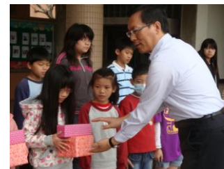
校長頒發模範生獎狀、獎品