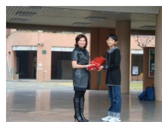
家長會長致贈全校兒童節禮物