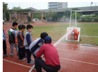
消防栓噴水滅火訓練