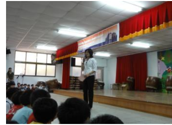
家長會陳會長致詞