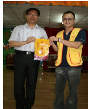
創世基金會感謝 全校師生愛心