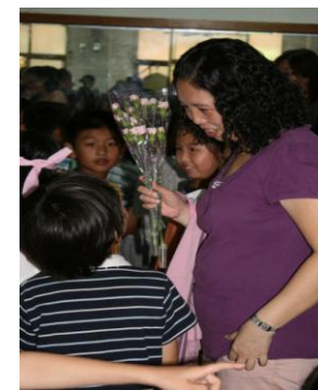
感恩！母愛！溫馨傳愛感謝家人養育恩