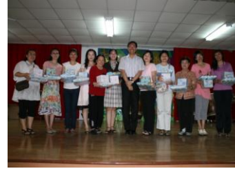
頒發資深績優志工獎狀