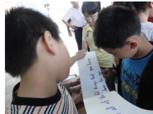
籤王闖關唸出英語句子