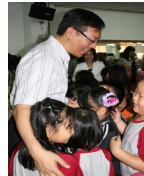
心存感激敬師長 教導恩