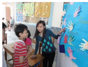
骰子大天使唸出單字