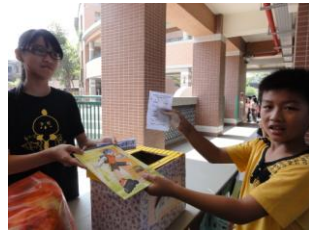
闖關成功！領取獎品囉