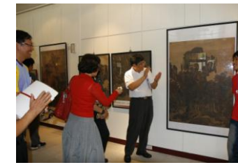
藝術小尖兵進行解說導覽