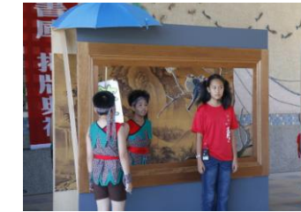
英語小尖兵話宋畫表演