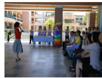
廣達文教基金會楊執行長致詞