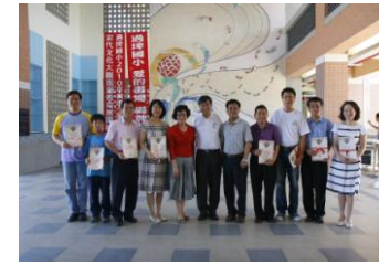
頒發同盟學校小尖兵服務證書