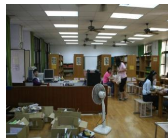
幾萬冊的書籍要打包~