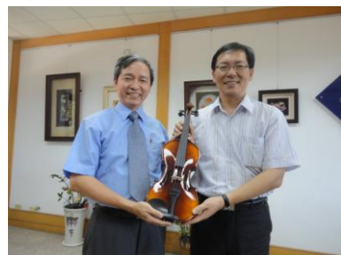
張延惠教授致贈小提琴給本校英語村音樂館