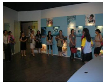
文藻外語學院教授暨本市英語教師參訪英語村