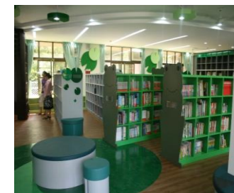
志工媽媽們幫書本搬家囉