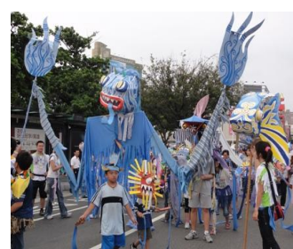
讓大家眼睛為之一亮