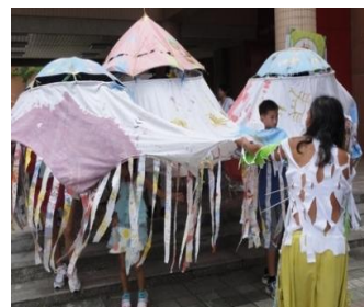
震撼人心的踩街隊伍