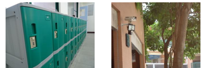
添購班級教室學生個人置物櫃