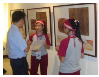
廣達游於藝小尖兵導覽