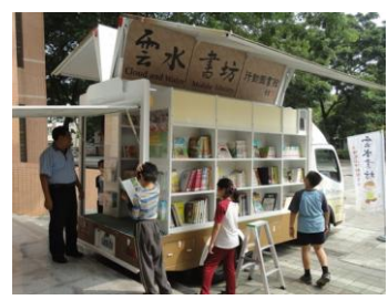
南屏別院行動圖書館