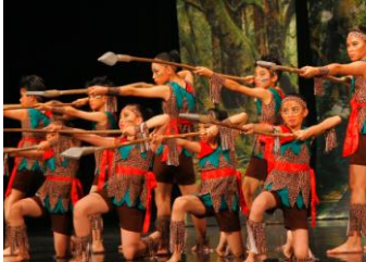
全國舞蹈賽現代舞優等