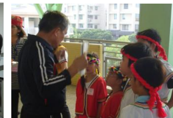
開辦原住民及客家社團