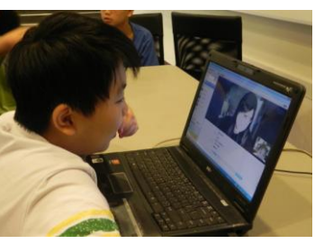
義守大學英語視訊連線