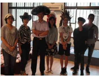
樹科大各國傳統服裝設計