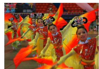
全縣舞蹈賽古典舞優等