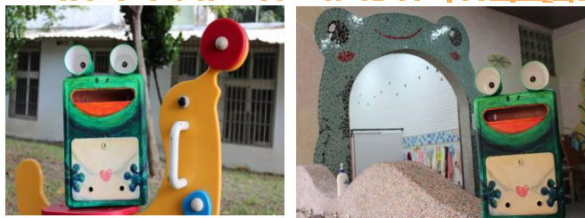
可愛的埤埤蛙信箱，等您來信喔！