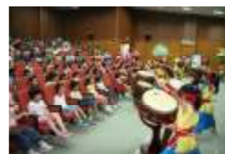
鑼鼓喧騰迎新--十鼓表演