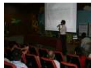
校長與新生家長座談