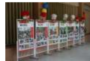
班級教學環境佈置