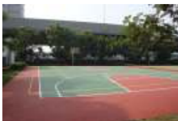
東側球場修補竣工