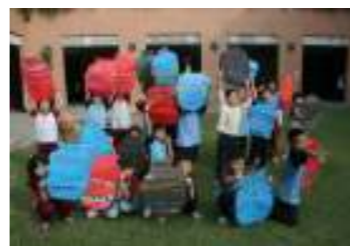
外聘師資協同指導藝術課程