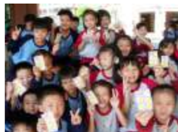
一年級注音符號闖關