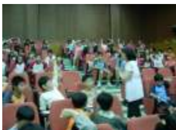
五、六級用藥安全宣導