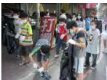
五年級入社區為環境盡一份心